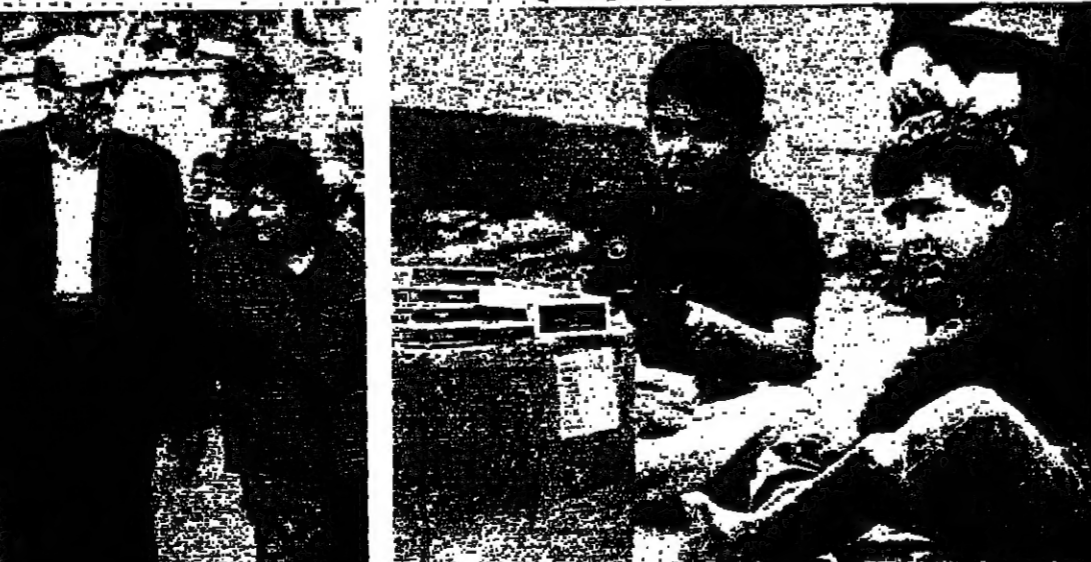
طفلة بيعان السجائر في حين الشبك